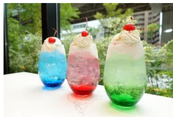
懐かしのクリームソーダ 500円