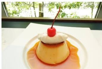
カスタードプリン 400円