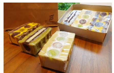
※テイクアウトイメージ