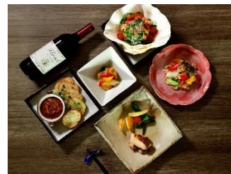
※料理の写真はイメージ

京都のイメージを表現するように、フランス料理のシェフが一皿一皿心を込めて仕上げた京風フレンチを、温かみを感じる和食器に盛り付けお箸でいただくスタイルでご提供いたします。心が和むゆったりとした空間で朝食にはビュッフェを、夕食にはセットメニューやアラカルトなど豊富なメニューをご用意しおひとり様からご家族での食事会などにもご対応いたします。また、季節に合わせてメニュー内容が変わる、ディナー付き宿泊プランも併せて販売を開始いたします。