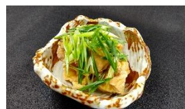
酒粕でマリネした鶏の唐揚げ 九条ねぎを散らして