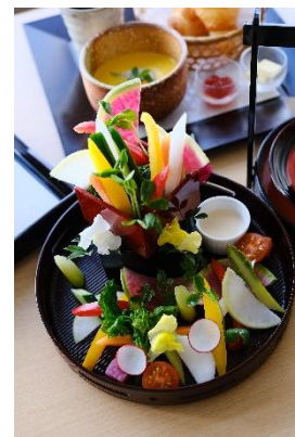
鮮やか野菜のバーニャカウダ (2名様分)