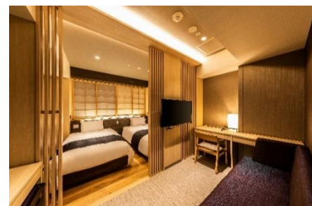
ジャパニーズツイン